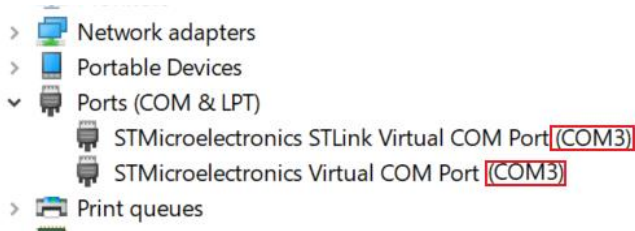
Obrázek 1 Situace v Device manager

V případě, že se při použití kitu Nucleo STM32 pro programování externího mikrořadiče STM32F042F6P6 a jeho komunikaci prostřednictvím kanálu UART náhodou čísla Virtual COM Portů shodují,